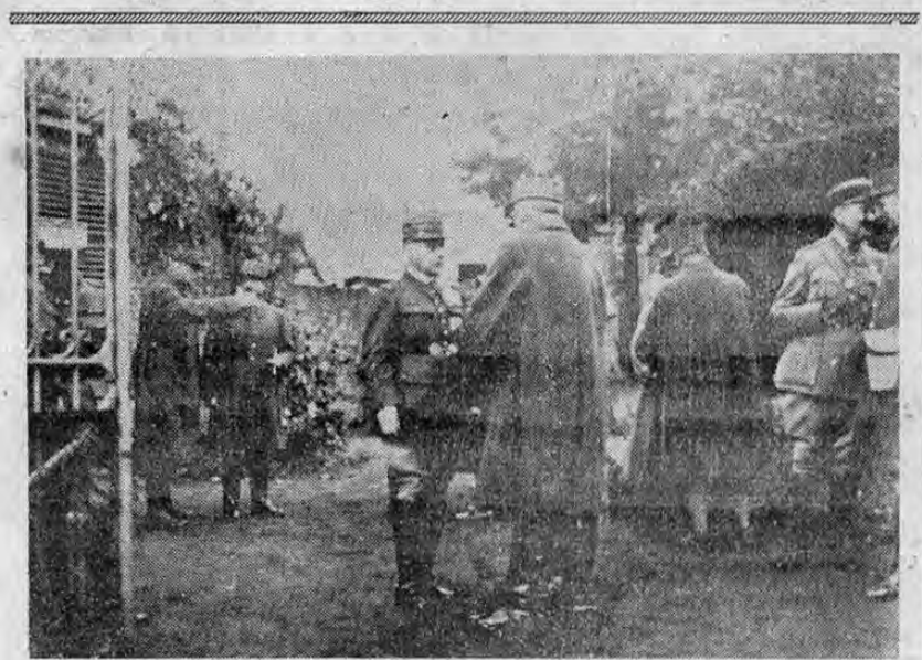
EL GENERALÍSIMO EN SU CUARTEL GENERAL DEL ESTE.—Detrás de la línea Maginot, en "algún lugar de Lorena" el generalísimo muestra al general Gamelin conversando con un general de división, comandante de un grupo de los jefes hablan otros generales y altos oficiales nota a Gamelin sin sobretodo no obstante que el

LA GRAN BRETAÑA SE NEGABA A DEVOLVER LOS PRISIONEROS DEL "ALTMARK"